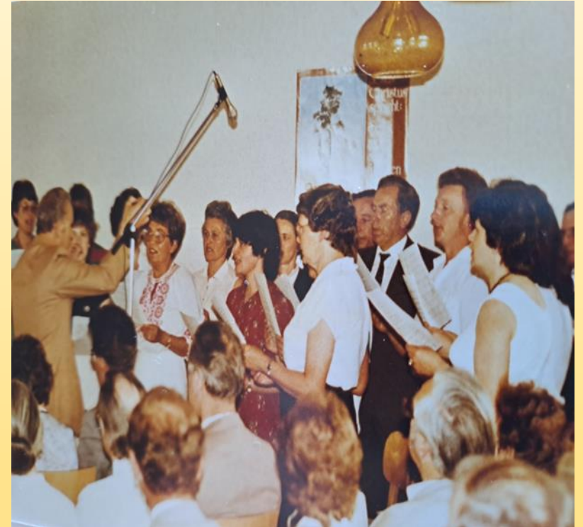
Festgottesdienst in Wetter – 100 Jahre „Stadtmission“